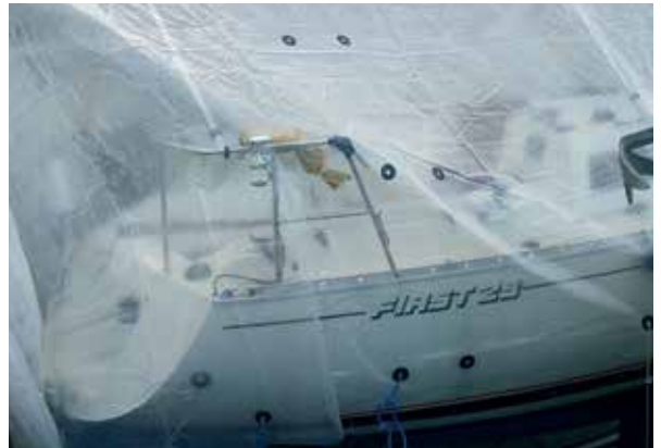
Monarflex® Multicover båtpresenning

Monarflex Multicover er en 0,180mm tykk armert folie, fremstilt ved sammensmelting av LD-polyetylen på hver side av et kryssarmert nett av polyesterfibre. Presenningen er dermed helstøpt og uspaltelig. Monarflex Multicover har innstøpte gummimaljer for hver 95cm hele veien rundt, maljene perforeres først ved bruk.