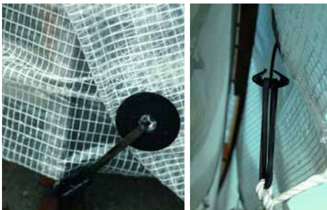
Armert polyetylenfolie og innstøpte gummimaljer på alle sider