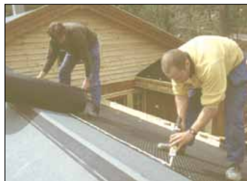
Fugemasse som sikring i omlegg.

Vekten av 15 cm torv er ca 1,3 - 3,0 kN/m 2 (130 - 300 kg/m 2 ), avhengig av nedbørsmengde, vanning og type torv. Krav til snølast varierer fra distrikt til distrikt (normalt 1,5 - 3,5 kN/m 2 ) og beregnes i tillegg.