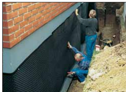
Smidig å jobbe med.

Det unike rillemønsteret fungerer som brettekanter og gjør monteringen rundt hjørner og over grunnmursålen rask og ukomplisert. Kantlisten sørger for tetting i overkant, og gir samtidig et godt anlegg for puss slik at den ferdige muren blir pen, og får en riktig avslutning. Spikerbrikke benyttes til feste av platen til mur. Den er spesielt tilpasset knastene og gir maksimal styrke mot nedrivning. Universal kantlist leveres i 2 m lengder.