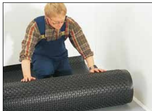
Ligger flat ved utrulling.

Fonda Universal er også velegnet som underlag ved påstøp, både med og uten varmekabler. Det unike rille-mønsteret forenkler og effektiviserer bretteing opp mot vegg. Du sparer tid, verktøy og fordyrende tilbehør.