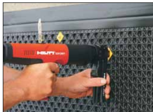
NYHET: Festebrikke for boltepestol.