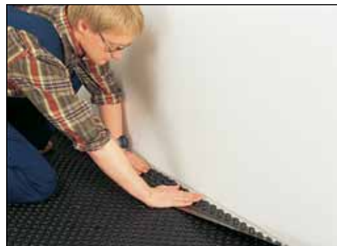
Enkel oppbrett ved kanten.