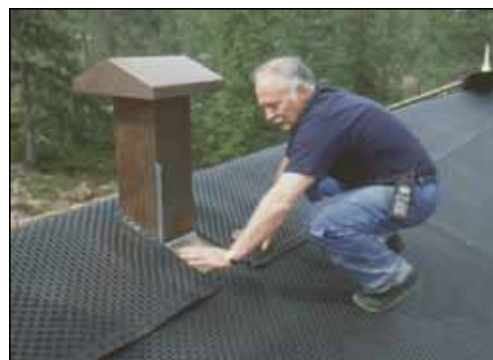
Sklisikker og trygg å gå på.