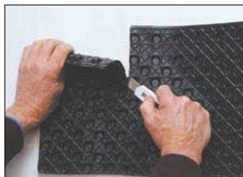
Rillene virker som skjæreanvisning.