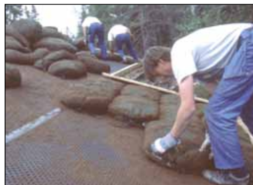
Rillene gir friksjon for torvlaget.