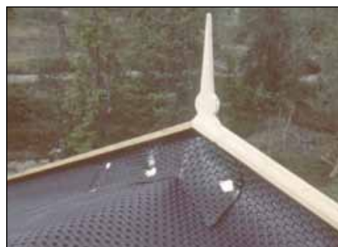
Sikkerhet ved avslutninger.